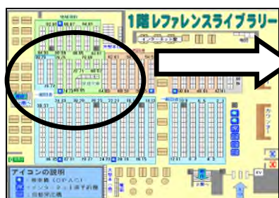
1階地域資料コーナー 配架図

1階レファレンスライブラリーの正面入口から、入って左奥に地域資料コーナーがあります。