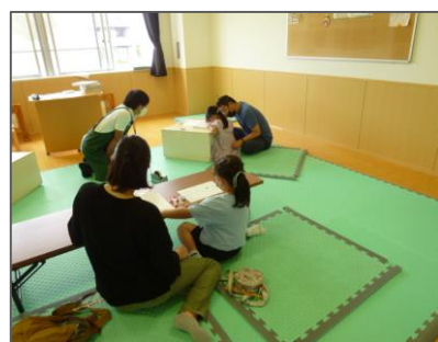
👉 テーマ展示に関連した内容の子ども向けワークショップを開催しました。終始和やかな雰囲気で行いました。