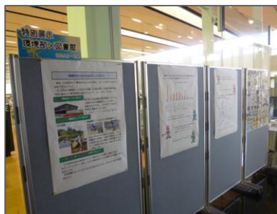
👉 市内の河川の水質調査に関するポスター展示の様子。