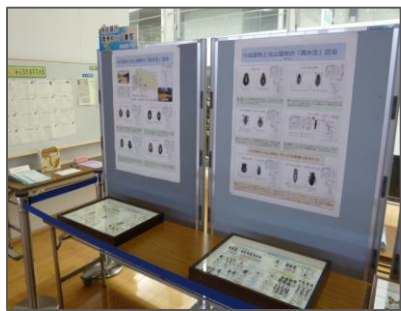
👉 北山湿地に生息する昆虫の標本とポスター。興味をもったかたは是非、北山湿地へ♪

北山湿地に生息する昆虫の標本や、河川の水質管理や検査、浄化槽の仕組みについての紹介パネル、ポイ捨て防止条例に関するパネルなどを展示しました！多くの来館者が足を止めて熱心にご覧になっていました。