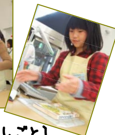
【カウンターのしごと】 かしだし・へんきやく