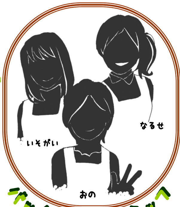
いそがい なるせ あの