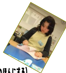
【バックヤードのしごと】 ほんのそうび(バーコードをはるなど)・うけいれ(としょかんのほんにする)