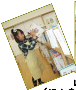
はいかさぎょう (ほんをたなへかえすしごと)

一日図書館司書体験 4月23日(土)・24日(日) 子ども図書室の仕事をしました。