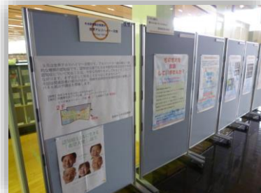
↑パネル展示「皆さんに知っていただきたい 認知症を診（み）る画像検査」の様子。放射線室の職員が認知症の検査についての紹介パネルを作成しました。