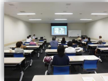
↑講座当日の様子。みなさん大変熱心に聴講されました。