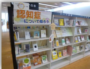
↑テーマ展示「認知症について知ろう」の棚。予防に関する本、エッセイなどを集めました。