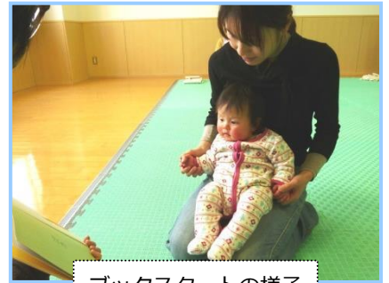
ブックスタートの様子

担当：中央図書館 資料提供サービス係（電話 0564-23-3115 FAX 0564-23-3165）