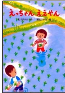
◆『えっちゃん ええやん』 くぶん出版 国松エリカ絵