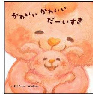
◆『かわいい かわいい だーいすき』 くアリス館 chico 絵