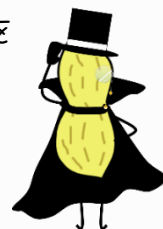
時には怪盗にもなっちゃうよ