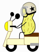
時にはバイクを乗りこなす